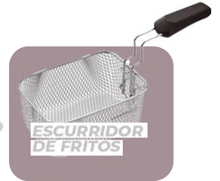
ESCURRIDOR DE FRITOS