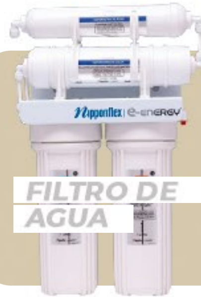
FILTRO DE AGUA